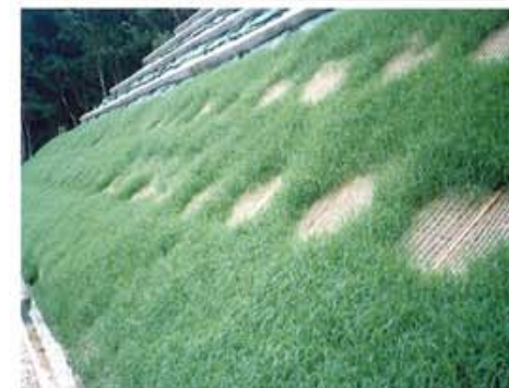
橘湾石炭火力発電所法面緑化工事 徳島県阿南市 1996.6 150m 2 1:1.0