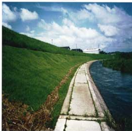
オケ崎護岸工事 鳥取県倉吉市 1997.5～6 550m 2 1:2.0